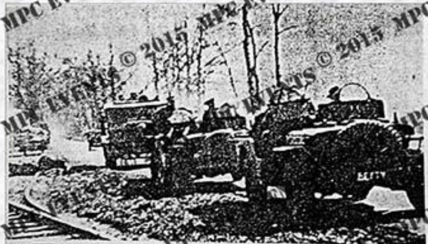
Le 1 er avril 1945, les SAS arrivent au pont de Oosterhesselen (Photo 184 Para)

De Belgische SAS bereikt de brug te Oosterhesselen.